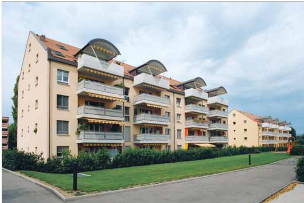
L'implantation des bâtiments est soulignée par de larges espaces verts