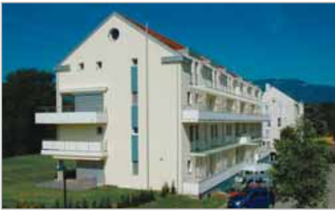
Les circulations sont réunies au Nord du bâtiment