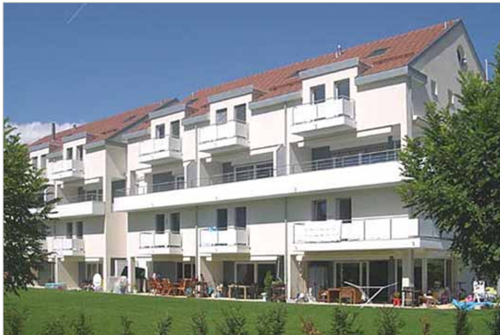
Bâtiment composé de 12 appartements en duplex ou triplex type "villa"

Michel de Kalbermatten Les Chesaux-Dessus E2 1264 Saint-Cergue kalber@bluewin.ch