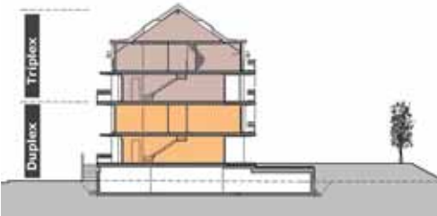
Plan type des appartements en triplex